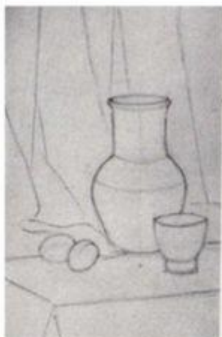
Рис. 1 Подготовительный рисунок